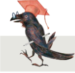
Rabe mit Professorenhut: Profaxtier ... x steht für «ks» oder «gs».