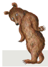
Der Bär ist unser Leittier für Wörter mit langem Vokal.