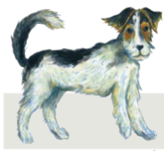
Der Hund steht für Wörter mit kurzem Vokal.